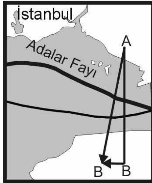
Şekil 1 Adalar Fayı üzerinde biriken gerilme AB: İki blok herhangi iki nokta arasında alınan uzaklık (dik kenar) BB': İki blok arasında sağ yanal ötelenme miktarı (kısa dik kenar) AB': Ötelenme sonrasında iki blok arasındaki oluşan yeni uzaklık (hipotenüs)

Örneğin, Doğu Marmara'da Adalar Fayı (50 km.) ve Adalar Fayı'ndan batıya Gaziköy'e kadar uzanan 110 km.lik parça, kırılma kinematığı açısından üzerinde büyük deprem olacağı tahmin edilen faylardır. Eğer Marmara'da ana depremler bu iki fayda oluyor ise bu durumda, Batı Marmara'da 18, Doğu Marmara'da 3 deprem olması gerekirdi. Bu modele göre Batı kolunda olması gereken bu 18 depremin aralarındaki zaman aralıkları ve GPS hızlarından elde edilen birikime göre, ancak bu fayın üzerinde yıkıcı diyebileceğimiz depremler 4 tanedir. Bu durumda, Marmara denizi çevresinde yıkıcı olan 14 tarihsel depremin olmaması gerekir. Bu da tarihsel verilerde sözü edilen yıkımları açıklamamaktadır. Doğu Marmara'da Adalar Fayı'nın 50 km boyu ve 12 km sismojenik zon göze alındığında, olması gereken üç tarihsel depremin büyüklükleri, etki alanları ve oluşturabilecekleri yıkımlar da tarihsel verilerle uymamaktadır.